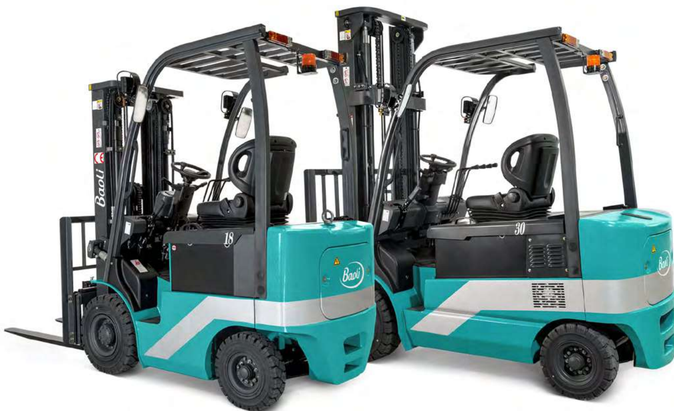
KBE 18 KBE 30