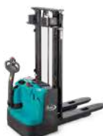
ES 12-N03 ES 16-N02